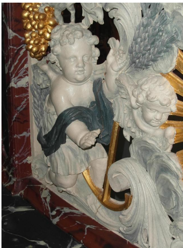
Enkhuizer communiebank - engel met anker, symbool van het geloof