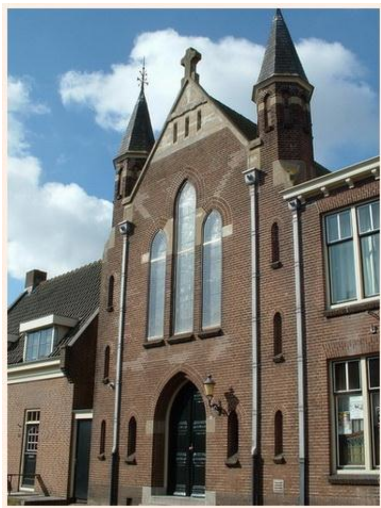
Oud-Katholieke kerk van de H.H. Gummarus en Pancratius parochie Breedstraat 84, 1601 KE Enkhuizen